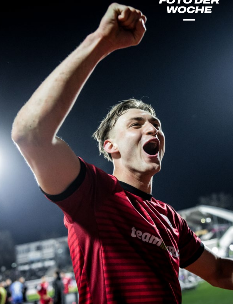
FOTO DER WOCHE