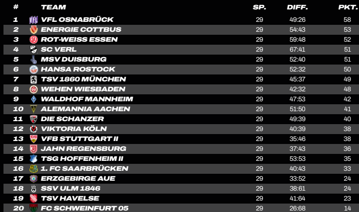
TABELLE & TORJÄGER