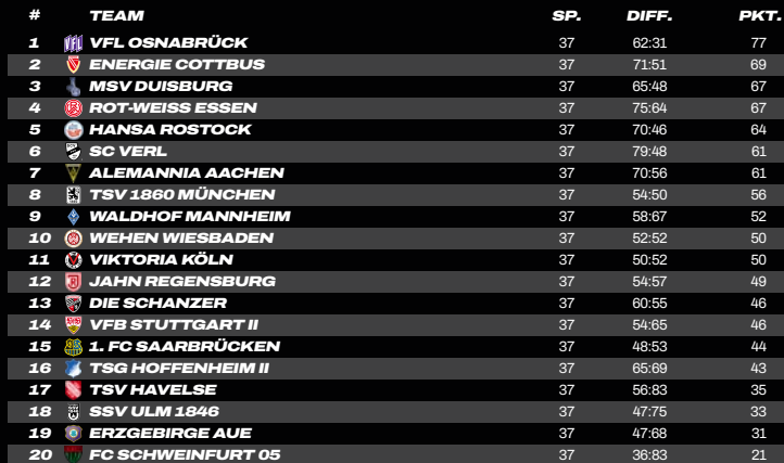
TABELLE & TORJÄGER