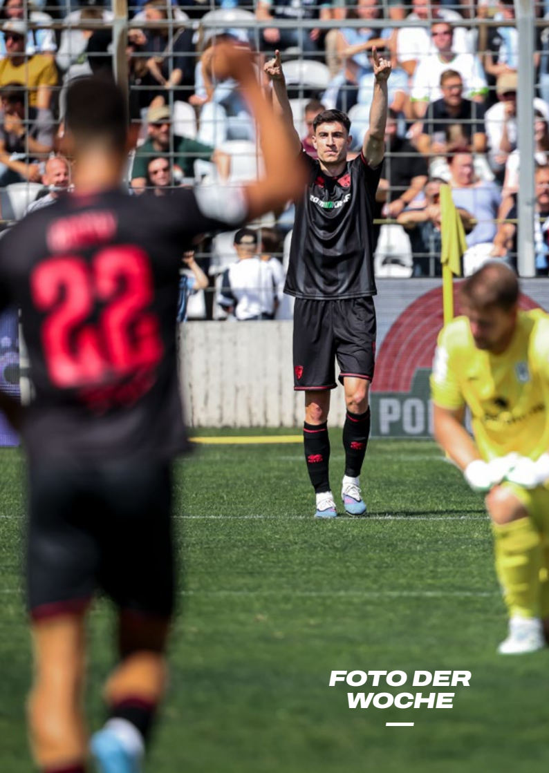
FOTO DER WOCHE